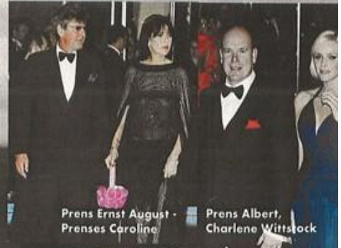
Prens Ernst August - Prens Caroline